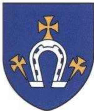
Rys. 1. Dąbrowa Herb Rostkowskich (używali też innych herbów)

W latach siedemdziesiątych XX wieku historycy z Polskiej Akademii Nauk opracowali atlas Mazowsza według danych z drugiej połowy XVI wieku. Na podstawie starych opisów, akt i spisów podatkowych powstała wielka mapa tych ziem. Historycy umieścili na niej również małą osadę o nazwie Rostki Michałowice , zaznaczając, iż jej lokalizacja jest niepewna i wieś ta już nie istnieje. Michałowice zaznaczono w miejscu dzisiejszej wsi Rostki Daćbogi, tak więc prawdopodobnie właśnie tak nazywała się niegdyś ta miejscowość i była częścią „okolicy szlacheckiej” Rostki, której główna miejscowość zlokalizowana była nad Bugiem. Rostki były siedzibą ubogiego rodu Rostkowskich, który tworzył tu zaścianki szlacheckie.