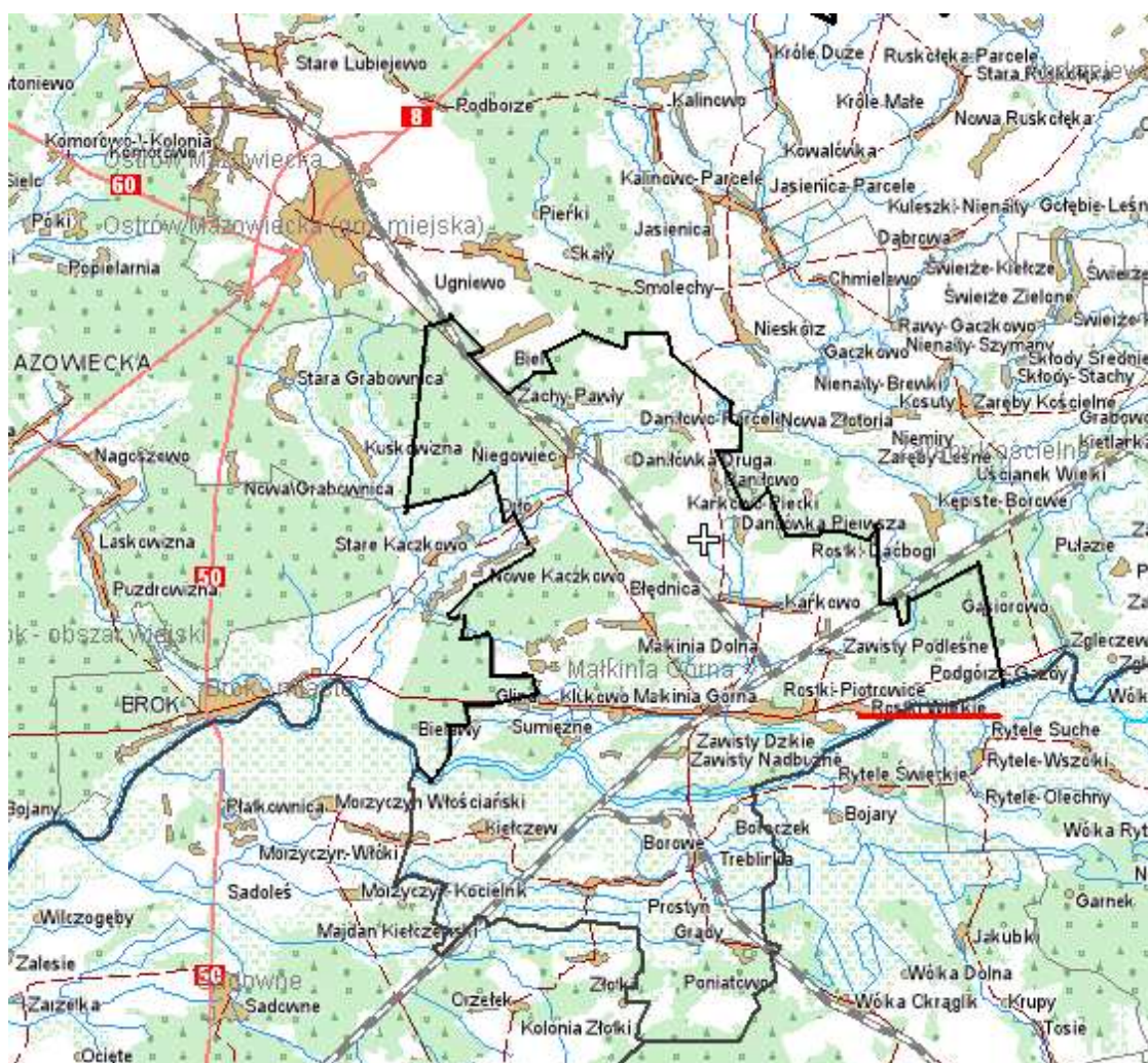
Mapa nr 1. Położenie miejscowości Rostki Wielkie w Gminie Małkinia Górna.

Z uwagi na położenie geograficzne gmina Małkinia Górna znajduje się w obrębie dwóch makroregionów: Niziny Północnomazowieckiej i Niziny Środkowomazowieckiej. Na obszar gminy składają się tereny należące do trzech mezoregionów: Miedzyrzecza Łomżyńskiego, Doliny Dolnego Bugu oraz Równiny Wołomińskiej. Rzeka Bug przepływając ze wschodu na zachód przecina obszar gminy na część północną i południową. Stanowi ona atrakcyjny szlak turystyki wodnej. Dolina rzeki Bug jest ważnym korytarzem ekologicznym. Stąd jest to obszar chroniony prawem polskim oraz zaliczony został do obszarów cennych przyrodniczo w skali europejskiej poprzez włączenie go do obszarów sieci Natura 2000. Na terenie gminy znajduje się 27 miejscowości w których zamieszkuje o 12 471 (dane na 2007) osób.